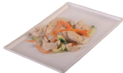
176 POLLO IN SALSA DI COCCO*