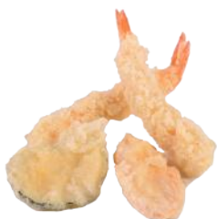
156 TEMPURA MIX* (4 PEZZI)