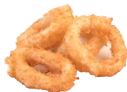
154 TEMPURA DI CALAMARI* (4 PEZZI)