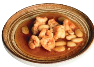
178 GAMBERI ALLE MANDORLE*