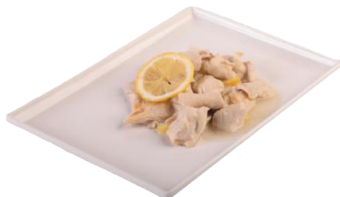
173 POLLO AL LIMONE*