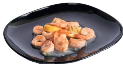
179 GAMBERETTI LEMON*