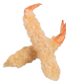
151 EBI TEMPURA* (2 PEZZI)