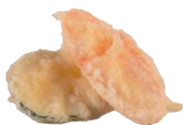
153 TEMPURA DI VERDURE (4 PEZZI)