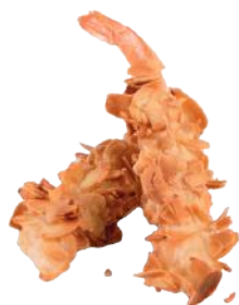
152 TEMPURA EBI MANDORLA* (2 PEZZI)