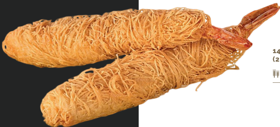
149 TEMPURA KATAIFI* (2 PEZZI)