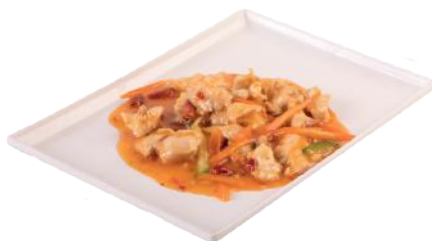
175 POLLO IN SALSA CHILLY*