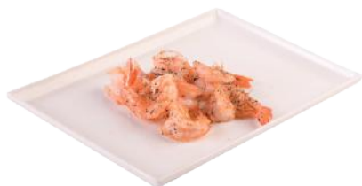
177 GAMBERETTI SALE E PEPE*