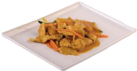
174 POLLO AL CURRY*