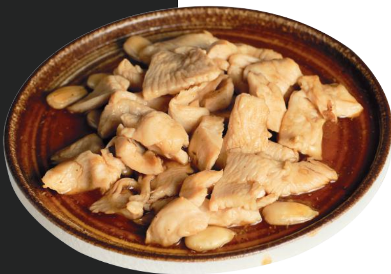
172 POLLO ALLE MANDORLE*