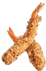
150 TEMPURA DI NOCCIOLA* (2 PEZZI)