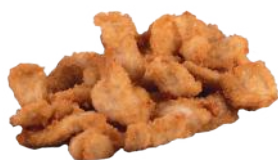
155 POLLO FRITTO*