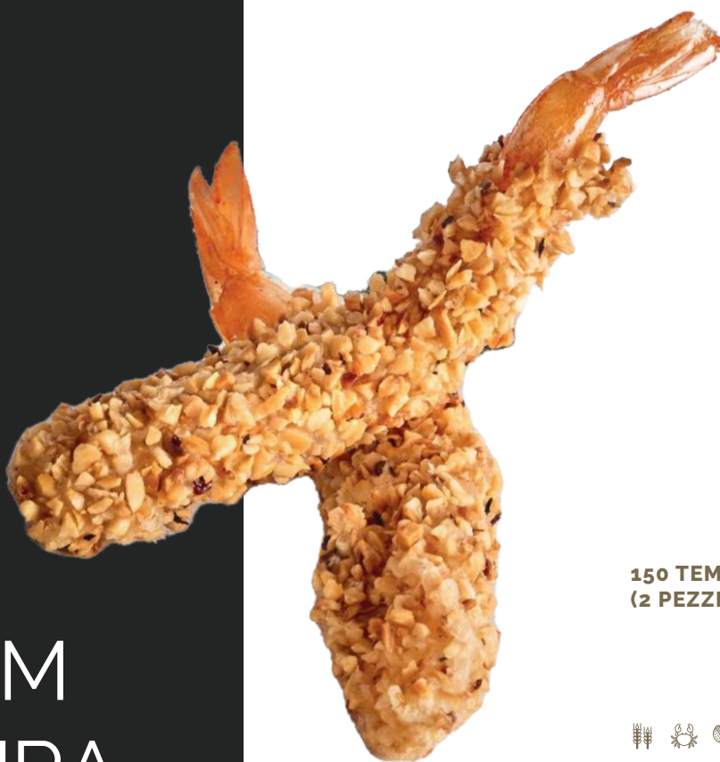
150 TEMPURA DI NOCCIOLA* (2 PEZZI)